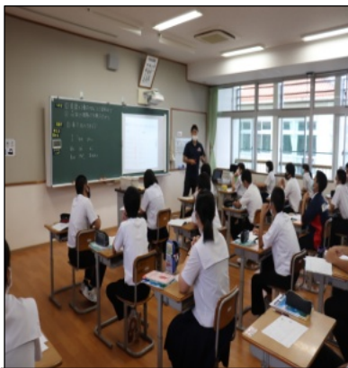
3年生・英語の授業 「主語」+「動詞」+「目的」 I like sports.